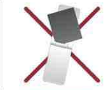
※携帯電話は使えません