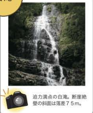
迫力満点の白滝。断崖絶壁の斜面は落差75m。