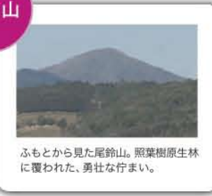
ふもとから見た尾鈴山。照葉樹原生林に覆われた、勇壮な佇まい。