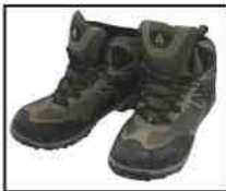
トレッキングシューズ