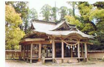
神楽殿・御輿庫(旧拜殿)

旧記によれば、日向国の第一の大社であったが、天正年間の大友・島津の争乱の際、御神体は避難されたものの、社殿・宝物・古文書などすべて焼失し、小さな祠があるのみ状態となった。その後秋月種政が元禄五年に復興し、安政六年に再建され、明治四年五月に県内最初の国幣社に列せられた。現在の御社殿は、旧社殿「末社」熊野神社(旧本殿)神楽殿・御輿庫(旧拜殿)の老朽化に伴い、平成十四年より「平成の大造営」と銘打って氏子崇敬者のご協力により、平成十九年七月に竣工した。