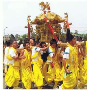
御神輿は国幣社列格50周年を記念し、大正11年に新調された。

現在でも県内外において勇壮で盛大なお祭りであり、その中でも2日のお宮入りは特に圧巻である。