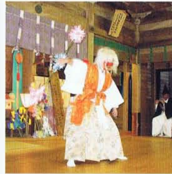
都農神楽 六番 鬼神舞